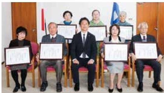
感謝状が渡された方々