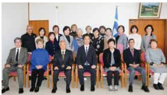
委嘱された民生委員児童委員