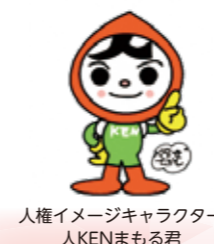
人権イメージキャラクター 人KENまるる君