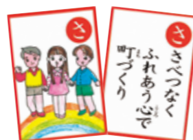
久山町道徳カルタ

久山町では、道徳教育等を通して、子どもたちの他者を理解する力や多様性を尊重する力を育む取り組みを行っています。