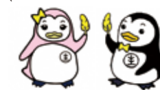
更生ペンギンの サラちゃんとおぼちゃん