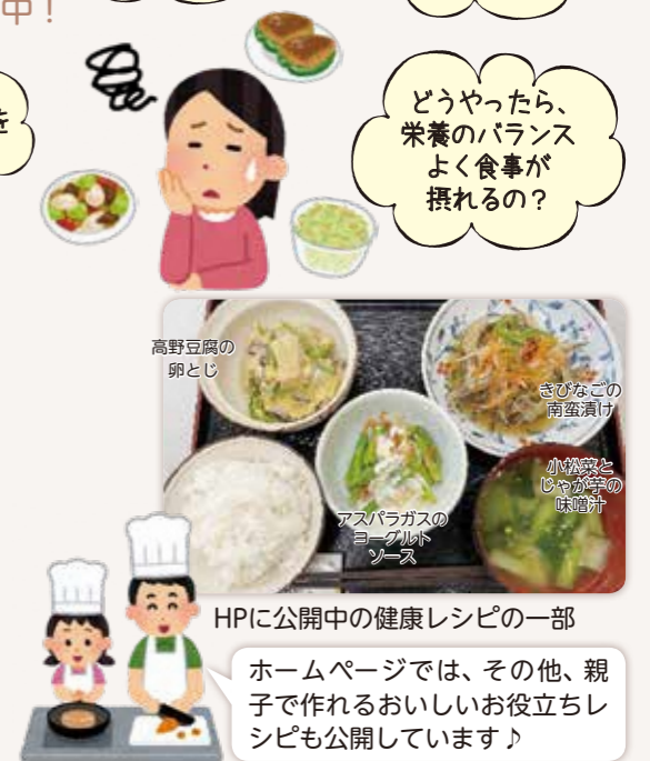
HPIに公開中の健康レシピの一部

ヘルスC&Cセンターでは管理栄養士による食事についてのご相談を随時受けております。 連絡先 ヘルスC&Cセンター ☎ 976-3377