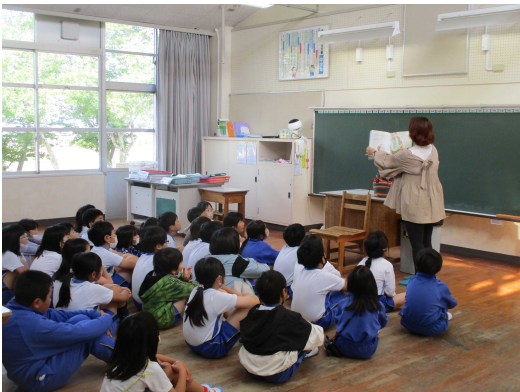
【目を輝かせてお話の世界にひたる子どもたち】

本年度も朝の活動で読み聞かせをしていただいています。子ども達が大好きな時間です。