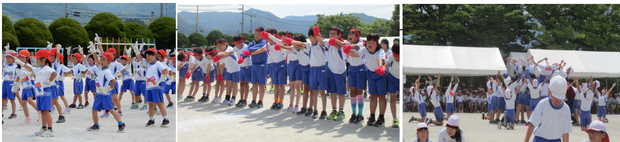
【低学年～夢の国でレッツダンス】

5月27日（土）に開催した運動会では、保護者の皆様には様々な面でご協力いただき、ありがとうございました。子どもたちは皆様の声援や拍手をもらうことで達成感を味わうことができました。どの学年も、めあてに向かって成長している姿を頼もしく思います。6年生は運動会の係活動の役割を立派に果たし、全校の手本となりながら小学校生活最後の運動会に取り組むことができました。これからも、職員一同子どもたちの学びと成長のために工夫改善を行いながら教育活動に取り組んでまいります。