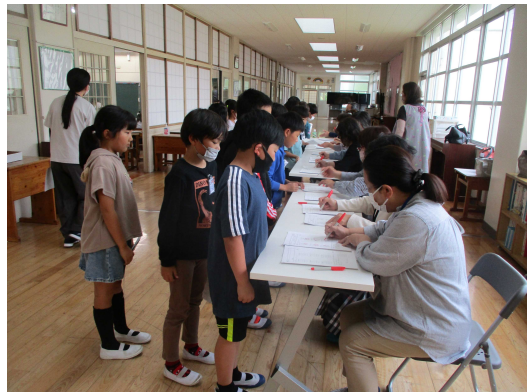
【意欲を高め、学習に取り組む子どもたち】