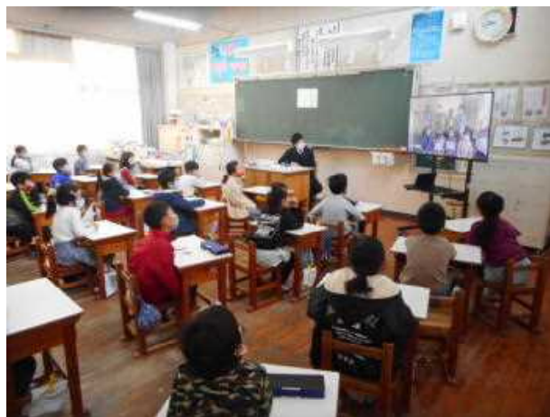
【教室でビデオを視聴をする2年生】

本校は、これまで学級にテレビが無く、全校一斉のテレビ放送ができなかったのですが、今回コロナ予算で各学級に1台、モニターとしてのテレビが購入され今回の集会が実現しました。在校生は、各学級でテレビを視聴し、6年生だけは、体育館の大型スクリーン(これも今年度コロナ予算で設置、電動で昇降します。)で保護者と一緒に参観しました。当初ビデオで6年生にどのくらい感謝とお祝いの気持ちを伝えられるかなと心配していましたが、様々な場所で発表を撮影できる、必要な部分を絞り与えられた時間を超えないように編集できる、