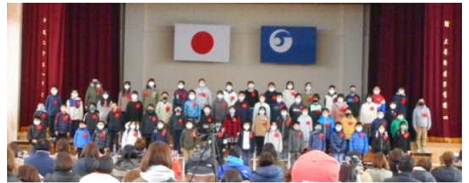
【4年生「2分の1成人式」の発表の様子】

2月は緊急事態宣言再発令のため、1・3・5年生の学習参観を中止といたしました。2年生「ありがとう発表会をひらこう」、4年生「2分の1成人式をしよう」、6年生「感謝の会(お別れ集会)」については、実施させていただきました。新型コロナウイルス感染症拡大防止にご協力いただきながら、ご参観いただきありがとうございました。子どもたちは、表現内容や方法を工夫して、この1年間の成長の姿を表現できたことと思います。