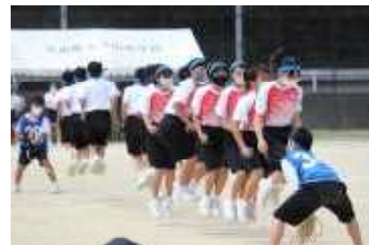
<学年競遊：1年生大縄跳び>