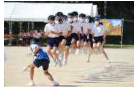
<学年競遊：2年生大縄跳び>