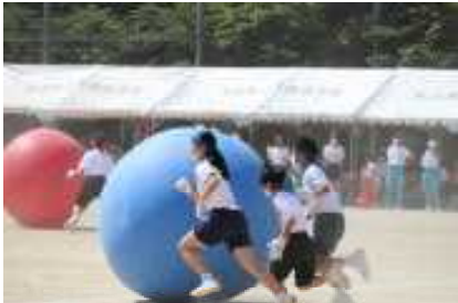
<ブロック競遊：大玉転がし>