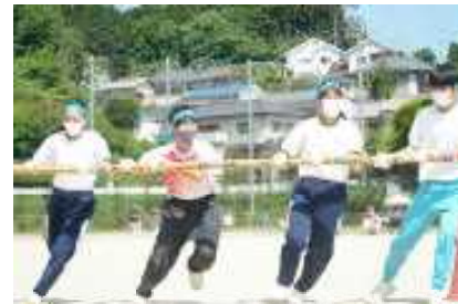
<ブロック競遊：巡回走>