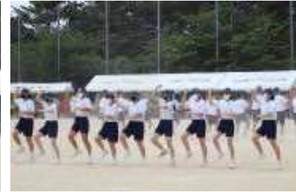
<学年競遊：3年生集団演技>