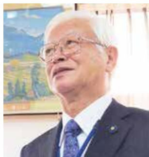
日本共産党 ほんた ひかる 議員 本田 光