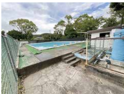
山田小の周辺整備前のプール状況

どが変わってくると思う。町民の皆さん、特に地域の方とお話しする機会がなかった。時代の流れで変化は必要だと思うが、今後説明をしていく場を持っていきたい。