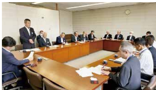
意見書提出の様子