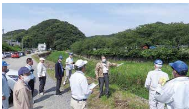
議会での現地確認の様子

そこで、6月議会において意見書を議員発議で提案、全員賛成で可決し、6月22日県庁へ出向き、管理者である福岡県土整備事務所へ議員10人全員で意見書を提出しました。