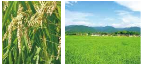
久山町の田園風景を守るために

人口減少・高齢化や気候変動の進行といった環境の変化を踏まえ、農業の担い手不足や農地・水管理、有害鳥獣被害などの現状と課題を把握することで、支援制度の活用も含めた対策の方向性を検討していき、「久山の農業をどう守り、持続可能な形で維持・発展させていくか」の道筋を探っていきます。