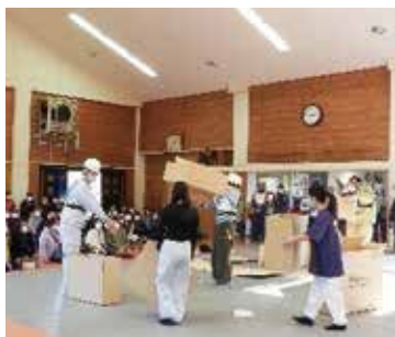
R 7年度 防災訓練の様子

激甚化する自然災害に対し、本町の消防・防災体制の強化、住民の防災意識向上にむけた取り組みの研究を行います。