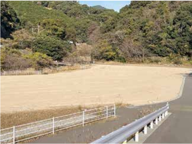
現在のBグラウンドの様子

A 基本計画の後に、来年度に実施設計等業務委託をしてからの工事となる。また、親水公園は河川の整備について県との協議も必要である。