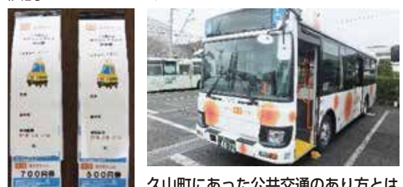
久山町にあった公共交通のあり方とは

イコバスやタクシーチケットなどの既存の交通手段に加え、デマンド交通やライドシェア等の新たな移動サービスも含めた「久山町の公共交通のあり方」について、利用実態や住民ニーズ、費用対効果、近隣自治体との連携の可能性等を把握することで、将来にわたって暮らしを支える公共交通の姿と、その実現に向けた方向性を検討していきます。