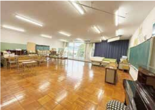
久山中学校特別支援教室

A 増設の教室に必要な電子黒板などの備品を今回の一般会計補正予算にて計上している。 (262万円)