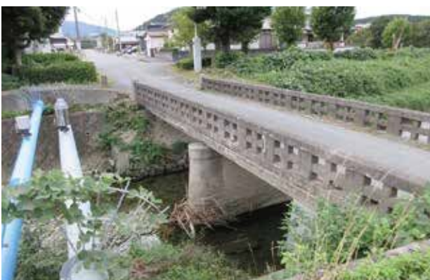
赤坂組合に架かる原橋

歩道を設置するにしても非常に費用がかかり現実的には難しいが、注意喚起の啓発は可能だと思う。今後検討はしていきたい。