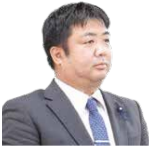
津原 健太郎 議員