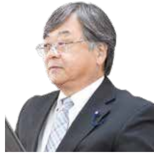
あべ 恒久 議員