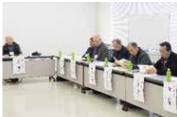
R 6年度の区長会と議会との意見交換会でも議題となりました

コミュニティの希薄化に伴い顕在化している課題について整理し、コミュニティ活性化に向けた取り組みの方向性および今後の検討課題を明らかにしていきます。