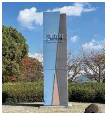
深井交差点のモニュメント

モニュメントは、年数がたつて色が落ちているということについては気になっている。今後予算の関係で調査次第、タイミングを見て塗り替えをしたいと思う。