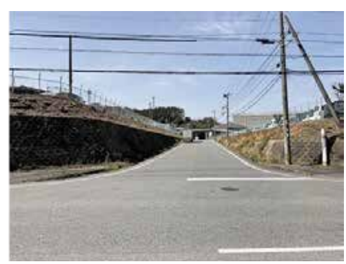
赤坂工業団地 (猪野地区)