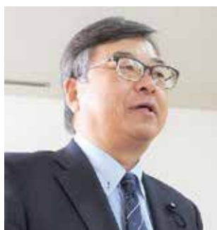
阿部 恒久 議員

本町には、2013年に国史跡に指定された首羅山遺跡があり、昨年は下久原の若八幡宮が国の登録有形文化財に登録された。また、片見鳥遺跡からは古墳時代を中心とした土器などが発見されている。これらの歴史文化遺産を活用した本町の魅力発信や観光促進について、どのように考えているのか。