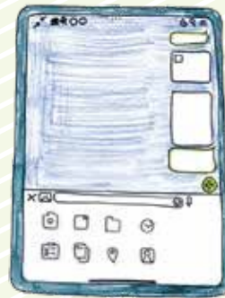
トーク画面イメージ ▶