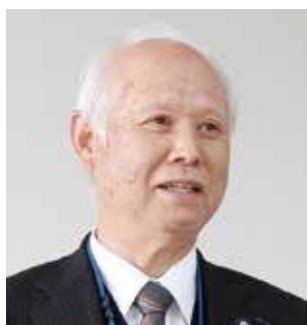
あべ 文俊 議員

自然災害や火災などが発生したら現場に駆け付け、我が身の危険を顧みず一丸となり献身的に活動に当たる消防団には、町民から大きな信頼と期待が寄せられている。大規模な自然災害においては、地域・消防団・行政の連携が不可欠となるが、行政としての考えと今後の計画は。