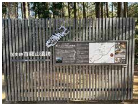
首羅山遺跡案内板

首羅山遺跡の発掘調査から国史跡に指定され、本町の史跡に対する意識は大きく変わった。学校教育の面においては、歴史史跡巡りの旅や歴史絵本の作成などがマスコミでも取り上げられ、本町独自の魅力発信の役割