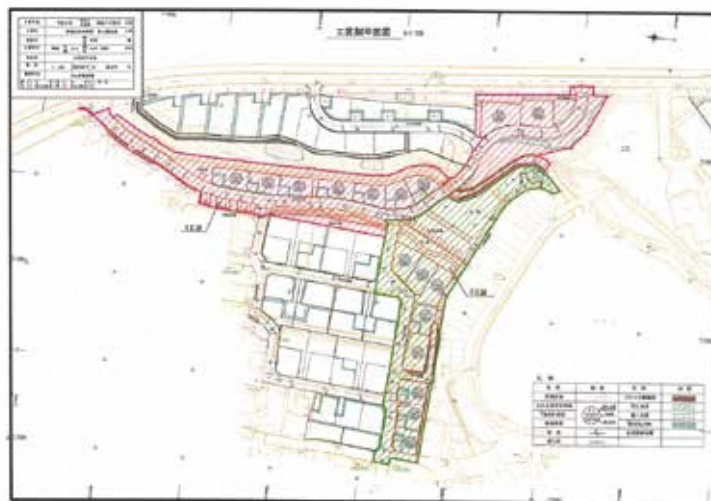
草場地区再開発第3期造成工事(1工区、2工区)施工箇所