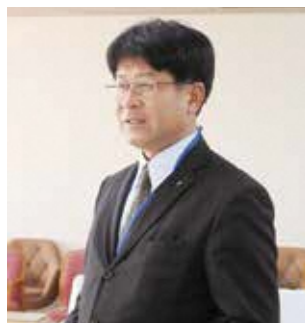
佐伯 勝宣 議員