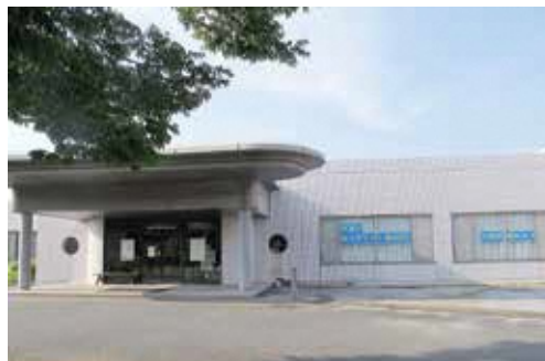
久山町民の住民健診が行われている C&Cセンター

PCR検査は保健所が対応するとなっているので、町独自の対応はとれない。糟屋郡内では、粕屋医師会の方で郡内に1カ所設置している。