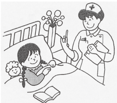
▲市町村国保の広域化と市町村の役割

県が標準税率を示してくると納付額を決めてくる。議員が言われたことも考慮しながら制度改正に取り組んでいきたい。