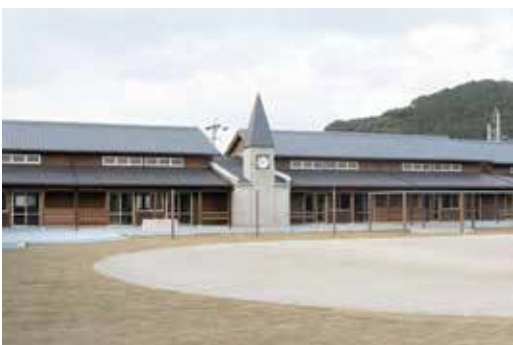
久山の木を使って建てたけやきの森幼稚園