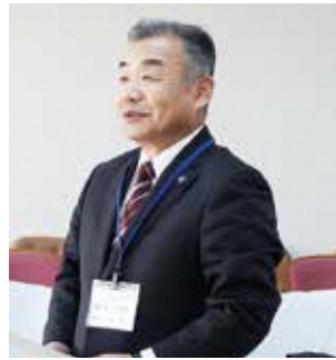
阿部 哲 議員