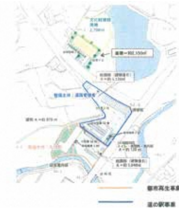
町の「久山道の駅事業」計画図(案) 「5040㎡」は建物を含んだ誤った表記である

言いたいことがよくわからない。 建物と土地面積を一緒にすることは あり得ない。土地取得で5000㎡ を超える時は議会の承認を得る必要 があるから、きちんとやっている。 建物の面積と一緒に面積を表示する ことはない。