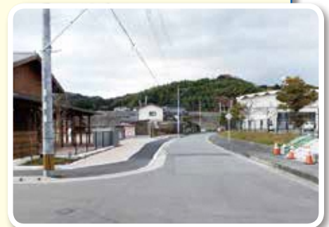
けやきの森幼稚園周辺