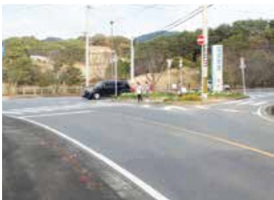
ゴルフ場と役場の間の三差路

今の状態と信号機の設置をした方が良いのか、関係者ならびに、県の公安委員会とも相談し、検討していく。