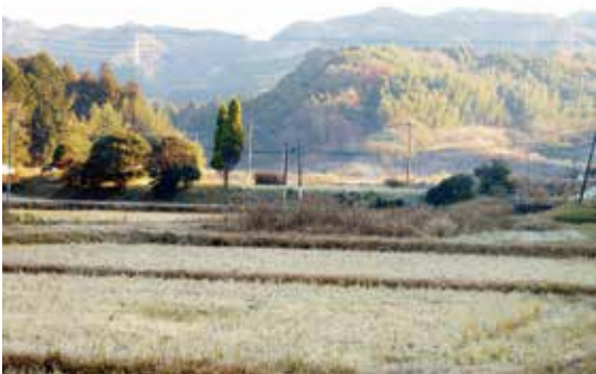
田園風景のある里山

久山町の田園風景を守ること、今つくづく感じている。今後については、農業法人の設立と合せて、町全体の農業振興整備計画の見直しの中で、農業で残していく所、そうでない所を見直し、町の田園環境を守るた