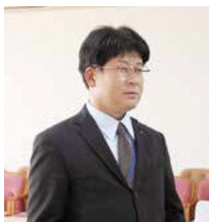
さえき かつのぶ 議員 佐伯 勝宣

空き家を猪野の住民から(まちづくりの)モデルケースに使って欲しいとの要望で無償提供された。今すでに3名応募がある。起業する中で地域の人たちに還元できるし、地域づくりのスペースと