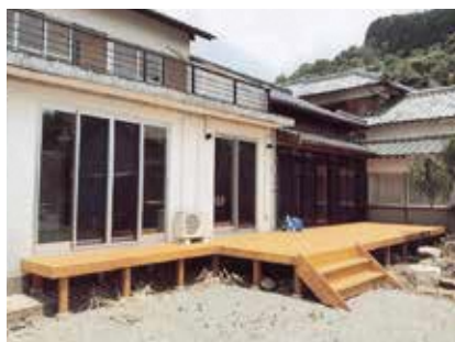
猪野のシェアオフィス

やるなら他にも適地はあつたはず。駐車場整備についても、近隣の住民は聞いていないという声がある。カフェなどの構想があれば、地元にもきちんと相談してやっていく必要があるのでは。