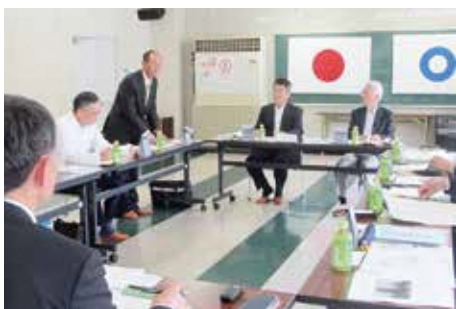
大洲市三善地区にて

15日は四国中央市防災センターにて地震の揺れ、消火活動、AEDなどの体験講座を受講した。体験したことにより、もしもの場合は率先して対応したい。