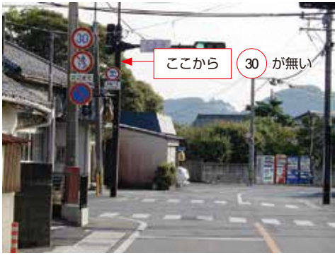
上山田交差点 小学校方向から

言われたが、30km制限がわかりにくい状況。例えば、小学校方向から上山田信号機の標示は30kmはここまで、対面標示は30kmがない。従って直進車は先は30km制限がないと思う。中学校方向から左折の場合も30km制限がわからない状況である。30kmゾーンを明確にしていきたい。