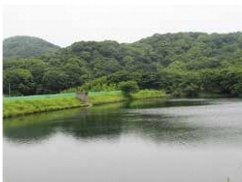
町内唯一の防災重点ため池(草場池)

そういう避難訓練に取り組む必要があると思うが、地域の事は地域の人でないと分らない部分もある。