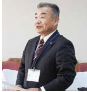
あべ 哲 議員