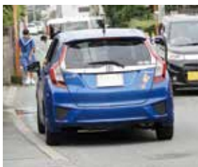
狭小な上山田中道の状況

町案内・施設案内など全体のサインは統一したサインで早く作りたい。その中で表示へも活用していきたい。