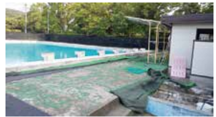
山田小学校プールの現状