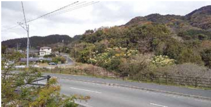
草場 12組付近の小山

令和3年度以降において、社会経済、その情勢等を見据え、準備を図ることが必要である。中・長期的に安定した財政基盤を築きながら、5年後、10年後、20年後の久山町の将来像に向かって必要な投資によるリターンと支出の調整を行う財政と、町の資産向上につながる事業を展開していく企画、この2つの役割を統合し、効果的な自治体運営を図っていきたい。