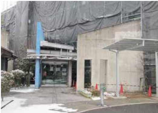
入り口までの一連の雨よげが必要と思われる部分

教育委員会でも確認したが、確かにロータリーがきつく少し歩道の部分に乗り上げるとは思った。