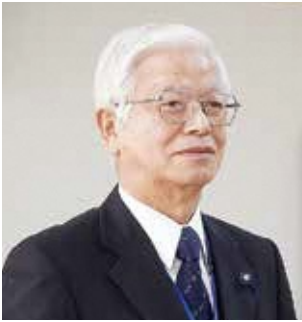
日本共産党 ひかる 本田 光 議員

11月30日、県のホームページでの発表では、新型コロナウイルス感染者数5827人内糟屋郡297人で県内3番目に多い感染者数となっている。新型コロナウイルス感染症拡大は収束にはほど遠い状況である。(1)新型コロナウイルス感染症拡大防止の重要課題として、検査と医療、保健、社会福祉、介護を拡充すること(2)雇用と事業を維持し、経済を持続可能にする政策を(3)未来を担