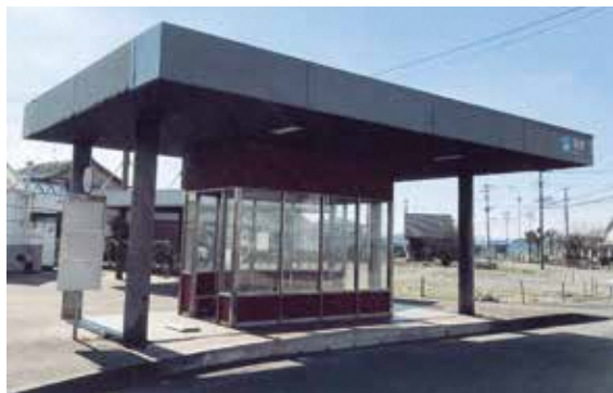
旧西鉄バス猪野バス停（現イコバスバス停）