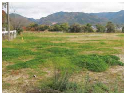
旧久原幼稚園跡地

施中である。旧久原幼稚園跡地は抵当権抹消登記が済み次第、売却できるよう協議していく。