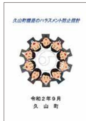
久山町職員のハラスメント防止指針

議会も私たち行政も含めて、今後社会的に取り組まなければならぬ。職員は、いろいろなところで業務等も多くなりながらも頑張っているということとは理解している。