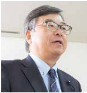
阿部 恒久 議員