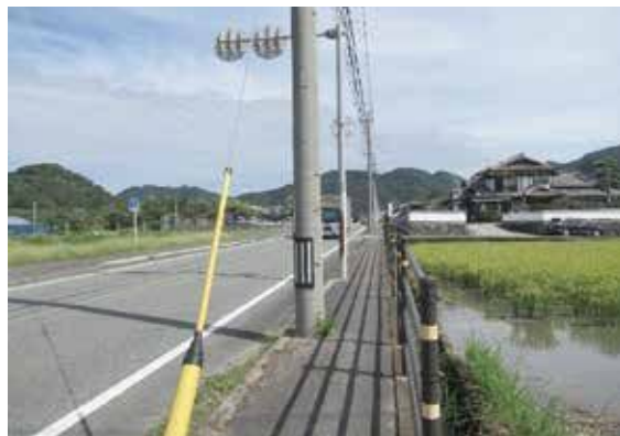
県道福岡直方線の歩道