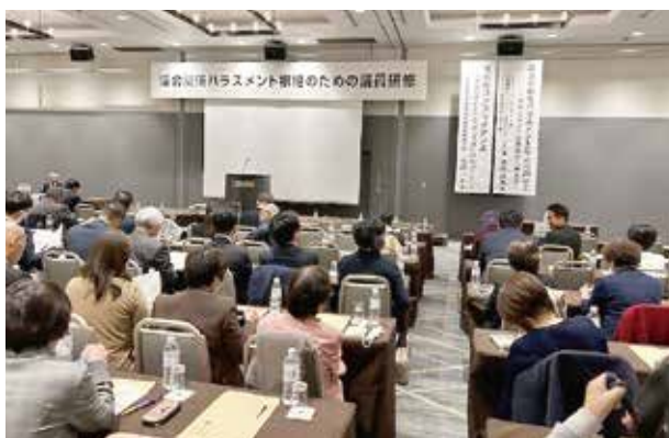
議員のハラスメント研修

措置を定めている。まずは、ハラスメントとは何か、ハラスメントが人権侵害であるという認識を全員で共有することが大切である。そのため、全職員に対し研修等を通じてその概念を認識してもらうよう取り組んでいる。