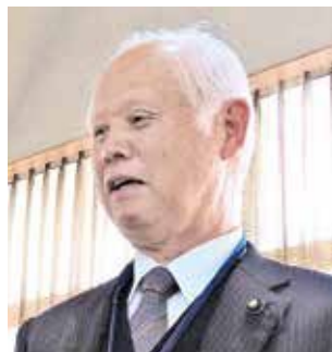
あべ ふみとし 議員