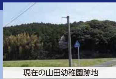
現在の山田幼稚園跡地

町が保有する普通財産の土地で処分可能なものは数少ないと捉える。 山田、久原両幼稚園跡地がこれにあたるが、けやきの森幼稚園に統合され早6年となる。種々問題があったとしても、長年放置し塩漬け土地とならぬようにしていただきたい。 長年、草刈等の維持管理費用の支出も好ましいものではないため、民間への開発委託を含めた早急な処分が必要と考える。