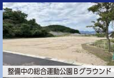
整備中の総合運動公園Bグラウンド

総合運動公園のB・Cグラウンドについて、いまだにその活用方法が決定していない。 担当課である都市整備課単独ではこの課題を解決しないのではと考える。 あらゆる方法を否定することなく、全庁挙げて取り組んでいく必要があると考える。