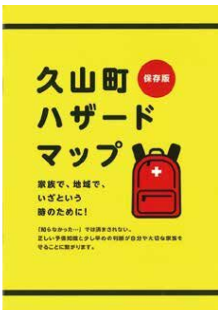
久山町ハザードマップ