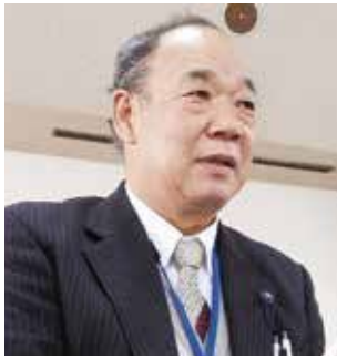
やまの ひさお 議員 山野 久生

食食については、生徒と保護者の回答が相反する結果となっている。どちらの声も大切に捉え、よりよい教育環境を整えるための資料として、今後検討、判断の材料とさせていただきます。