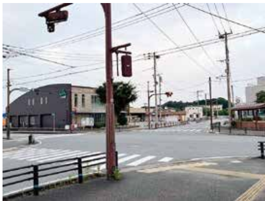
レスポアール久山側からみた久原交差点

渡ってJA側に渡る横断歩道はなかったという私の認識だった。だから2回渡るような形になっているという認識だった。そこに横断歩道があれば、地下道を渡ってそこを渡ればいいということになるので、もう一度その通学路については検討していきたい。