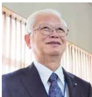
日本共産党 ほんだ ひかる 議員 本田 光