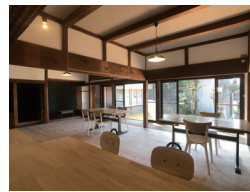
みんなのリビング オープンキッチンがあり打合せや会合など、 誰でも利用できます。