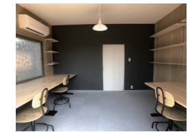
シェアオフィス 久山町での起業者等を支援するオフィス。 利用者は施設内の設備を利用できます。