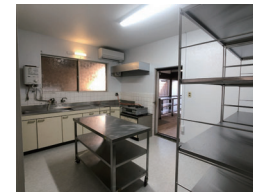
おかしキッチン 久山の素材を使ったお菓子の商品開発等に ご利用いただけます。