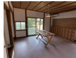
ものづくりラボ 絵や工作などのものづくりワークショップに ご利用いただけます。