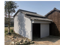
たくみガレージ プロの方々などによる大きなものづくりに 対応できる半屋外のガレージです。