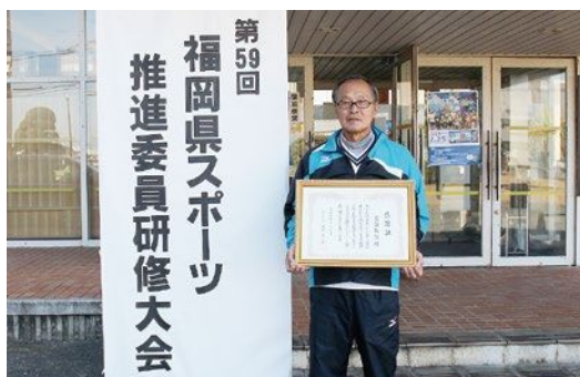
第59回 福岡県スポーツ 推進委員研修大会