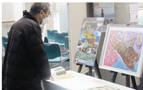
イベントでの絵本展示

英訳絵本「わたしたちの首羅山ものがたり(Our Mt.Shura Story)」は、昨年12月に行われた首羅山10周年記念イベントで初披露されました。今後は2冊を海外の学校や図書館などに送り、久山町の魅力向世界に向けて発信していく予定です。