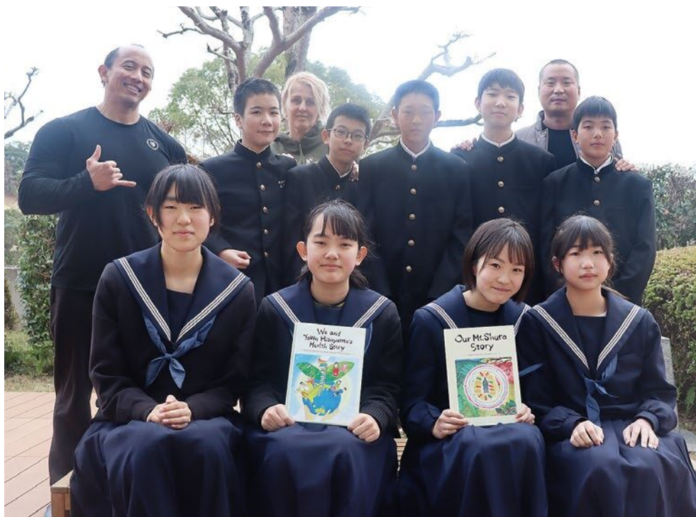
サマースクールに参加した生徒とALT