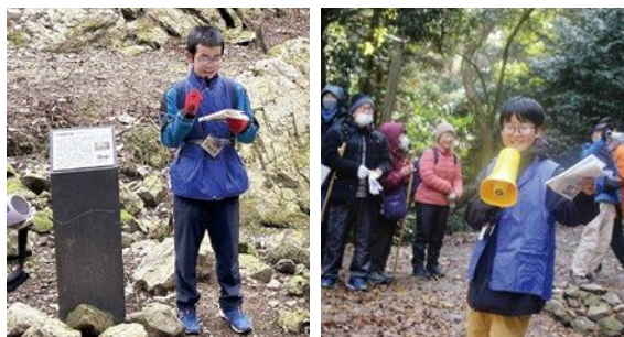
中学生ボランティアによる説明の様子