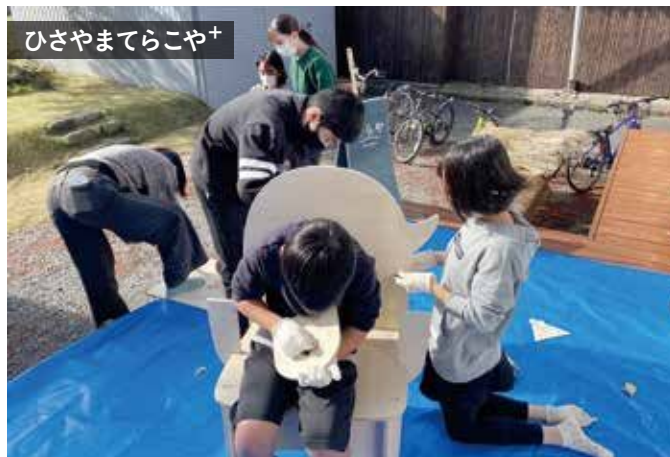
ひさやまてらこや+