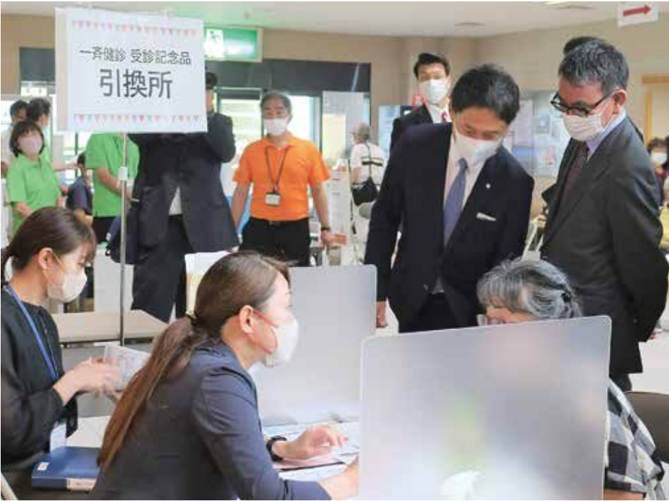
ひさやま健診を見学する河野大臣