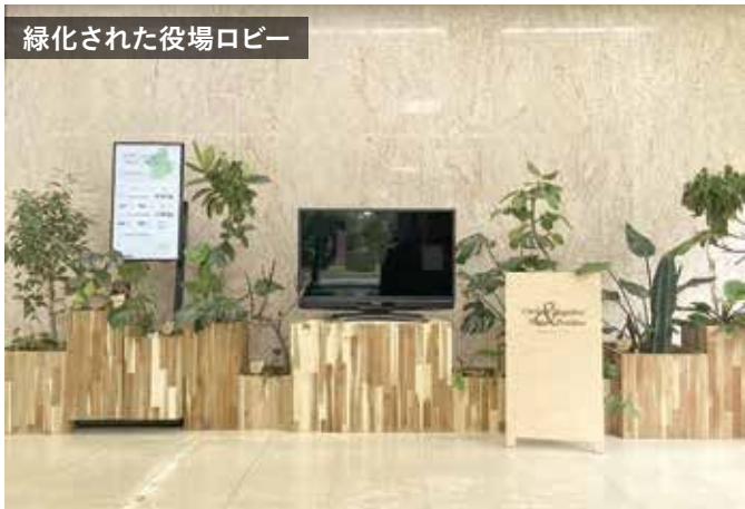
緑化された役場ロビー