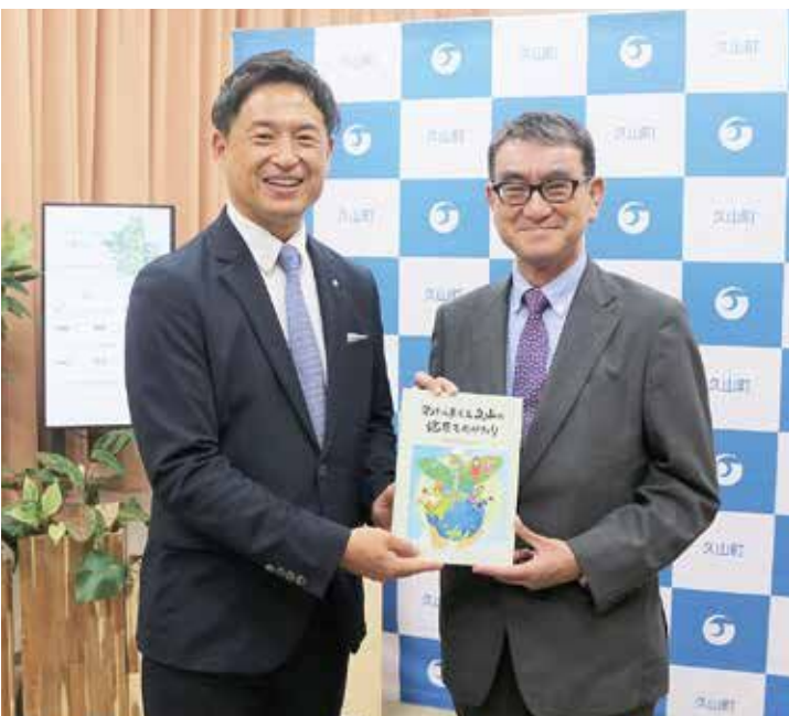
絵本「わたしたちと久山の健康ものがたり」を手にする河野大臣(右)と西村町長(左)

と久山の健康ものがたり」を渡すと、大臣はその場でページをめくって興味深く見入っていました。