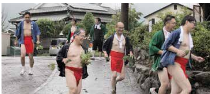
柿の葉を1万枚集めて神前にお供えする万度参り

祇園まつりは暑い夏を乗り切り無病息災と安全を祈願する中久原地区で継承されている伝統行事です。初日の奉納相撲大会、打ち上げ花火、櫓太鼓の演奏は大雨の影響によ