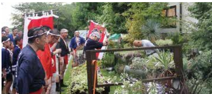
中久原区内を回り、各家を祓い清める清道廻り

り中止となり、2日目の万度参りと清道廻りは行われませんでした。 早朝6時から万度参りが始まり、「わっしょい！わっしょい！」の掛け声とともに法被姿の男性たちが須賀神社境内を駆け抜けました。